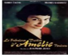
une affiche de film