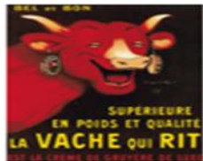
une affiche publicitaire / une pub