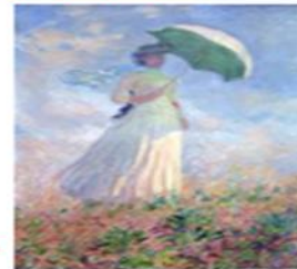
un tableau / une peinture