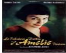
une affiche de film