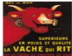
une affiche publicitaire / une pub