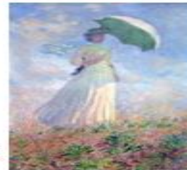
un tableau / une peinture